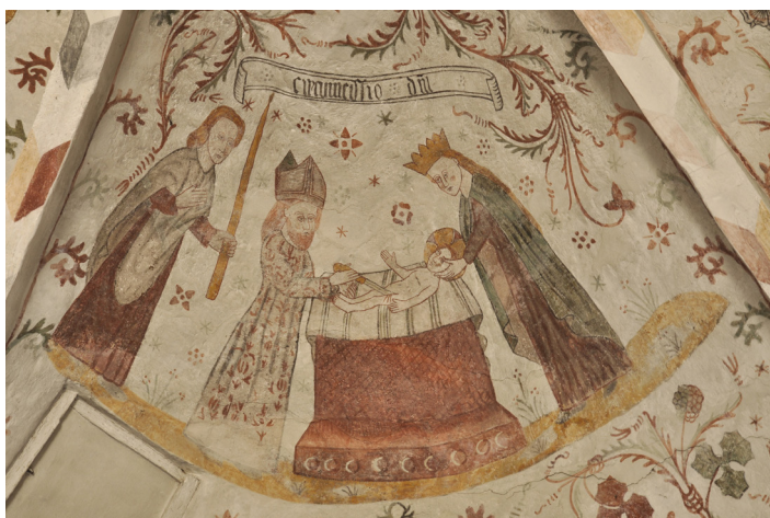
Jesus bliver omskåret på ottendedagen. Kalkmaleri fra Tingsted Kirke ved Nykøbing Falster udført af Elmelundemesterens værksted, omkring år 1500.